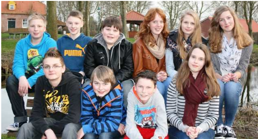
Unser Konfirmanden in Visquard

Wir werden am 6. April in Visquard konfirmiert