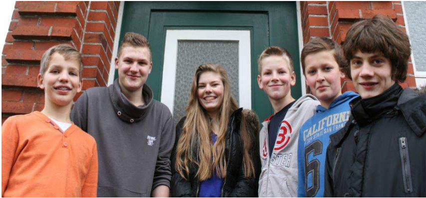
Unsere Konfirmanden in Groothusen

Wir werden am 13. April in Groothusen konfirmiert